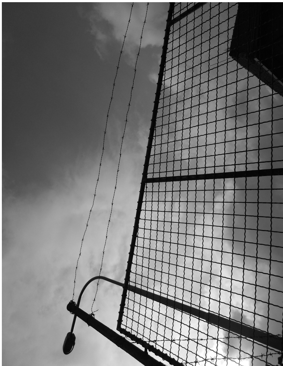
Nesvoboda (Denisa Střihavková, 2013)