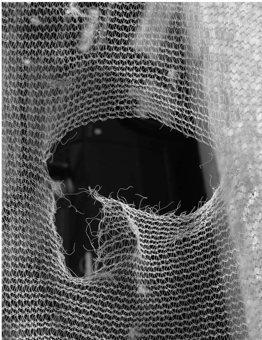
Díra a víra (Jiří Jedlička, 2011)