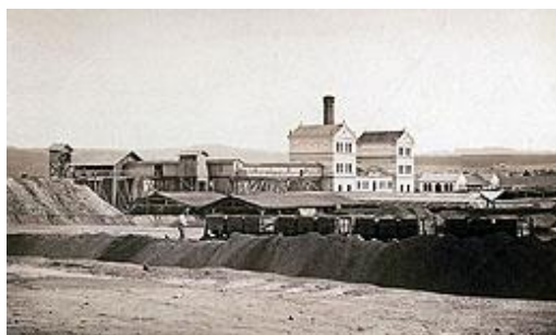
Bývalý důl Leopoldina, 1920

je dvouletým výstupem usilovné práce TS Večernice. Jde o průlet 650 lety historie města Mirošov u Rokycan. Aby se historická data dala zábavněji zapamatovat, tak byla vytvořena „létající“ postava průvodkyně pod jménem Johanka Markéta z Mytě, která však nebyla skutečnou historickou postavou. Její průlety krajinou jsou doprovázeny vypravěčem, který čte skutečné události regionu z dostupných archiválií, elektronických zdrojů, z rozhovorů s místními obyvateli, pracovníky institucí atd. Jinak citované postavy žily a tvořily v souvislostech dokumentu a byly dohledány v regionálních archivech, stejně tak příslušná heraldika apod.